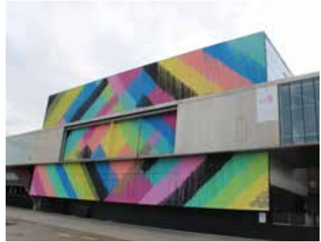
Oeuvre : «Future Past Sunrise» © N. Cincotta